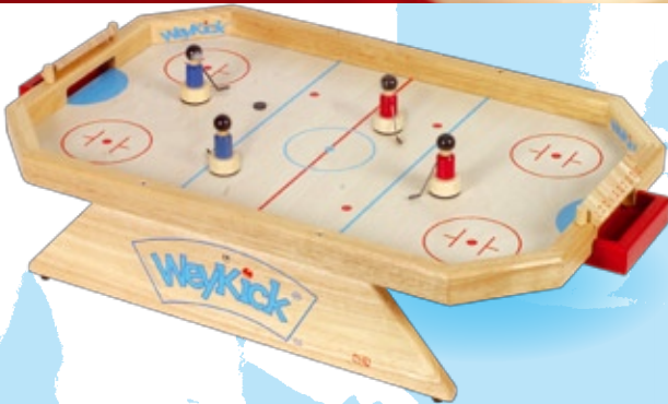
WeyKick on Ice Stadion 8500

Pour 2 à 4 joueurs. Comprendant : 4 joueurs de hockey (2 bleus / 2 rouges), 4 palets et 1 flacon de poudre de glisse.