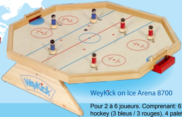
WeyKick on Ice Arena 8700

For 2-4 players. Including: 4 hockey players (2 blue and 2 red) 4 pucks and 1 bottle of powder