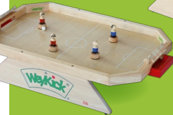
WeyKick Stadion 7500

This clever version keeps all the playing elements together, but the fun remains the same! A stable plexiglass plate and nets instead of goalposts help to keep the balls and playing magnets from getting lost. The guiding magnets are secured and yet freely moveable.