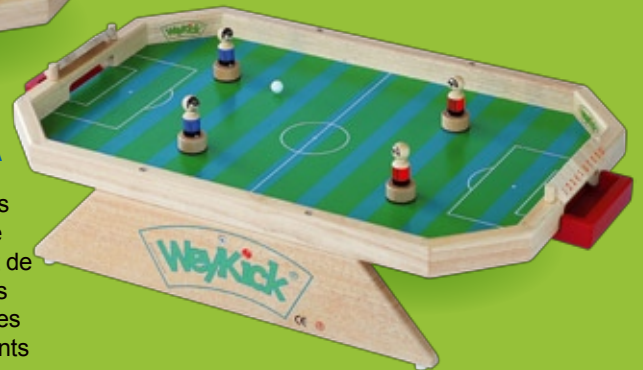
WeyKick Stadion 7500 G

For 2-4 players. Including: 4 football players (2 blue and 2 red) with guiding magnets, 3 footballs