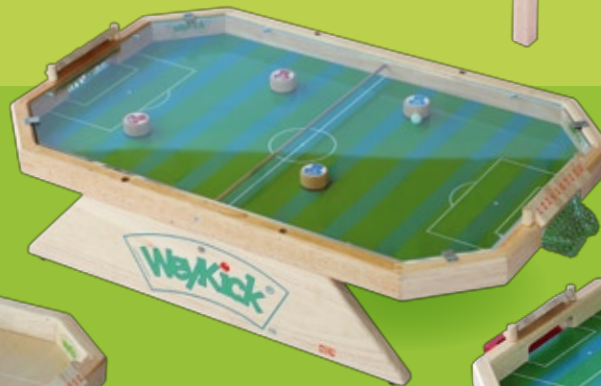
WeyKick Stadion Fix 7500 A

Multifunction : The WeyKick hockey players can also be used on the football field.